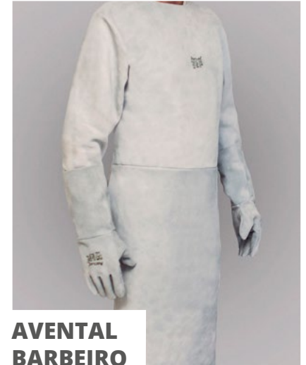
AVENTAL BARBEIRO SL/005

60x90cm 60x120cm 60x100cm 60x130cm 60x110cm 60x150cm