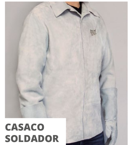
CASACO SOLDADOR SL/006